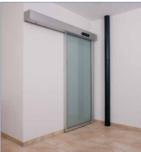
Hubertus Hotel Schluchsee