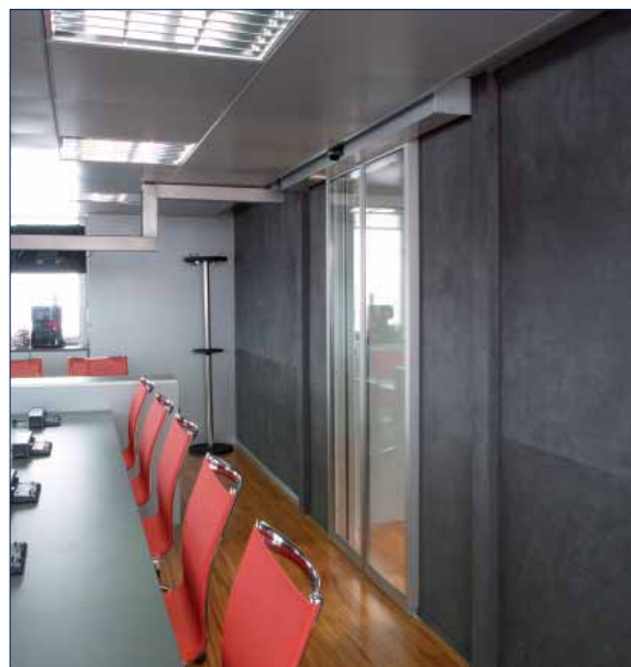
Scuderia Toro Rosso